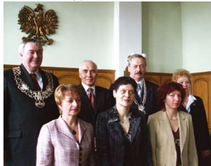
W takim składzie łotewska delegacja zawitała do Czeladzi po raz pierwszy