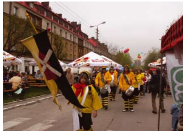
Ulicą 17 Lipca defilowali „Les Cacheux” wzbudzając wielkie zainteresowanie uczestników festynu