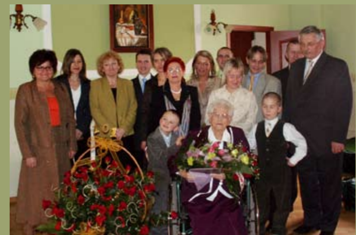
Jubilatka w otoczeniu rodziny i zaproszonych gości.