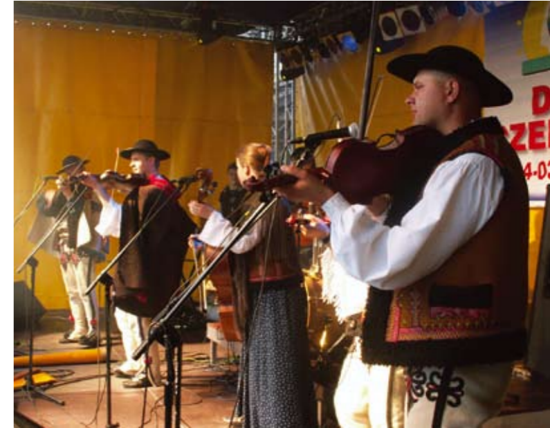
Co tam deszcz, Trzebunie Tutki rozgrały wszystkich swoich wielbicieli moknących w deszczu