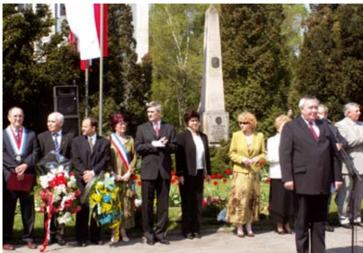
Do udziału w uroczystościach z okazji Święta Konstytucji zostały zaproszone delegacje z miast partnerskich.