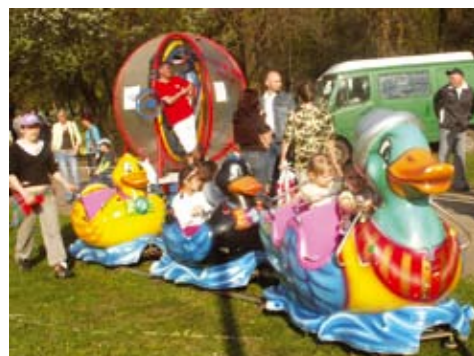
Do wyboru: podróż kaczka albo wirowanie w kuli: atrakcji dla dużych i małych nie brakowało