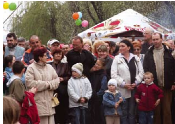
Mimo nie najlepszej aury festyn zgromadził wielu mieszkańców nie tylko osiedla Nowotki