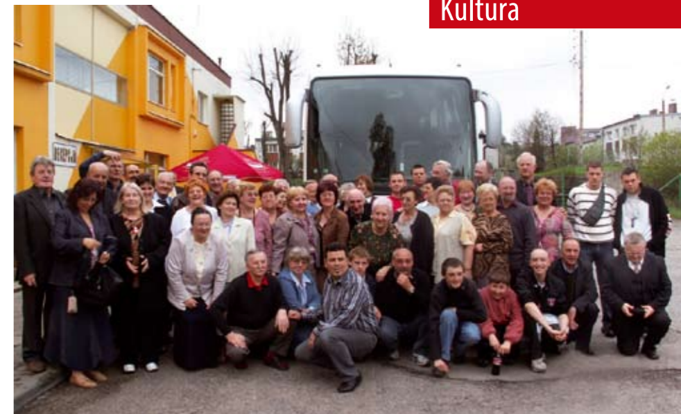
„Rodzinne” zdjęcie członków Towarzystwa Francusko-Polskiego w Auby i Towarzystwa Polsko-Francuskiego w Czeladzi.