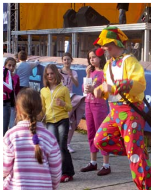
Trzpiot – klown zabawiał najmłodszych i rozdawał „firmowe” lizaki z logo Dni Czeladzi

Na scenie pojawił się zespół Gitan z piosenkami Garou, a po nim oczekiwany „Raz, dwa, trzy”. Było tak pięknie, że nikomu nie chciało się wracać do domu... (WK)