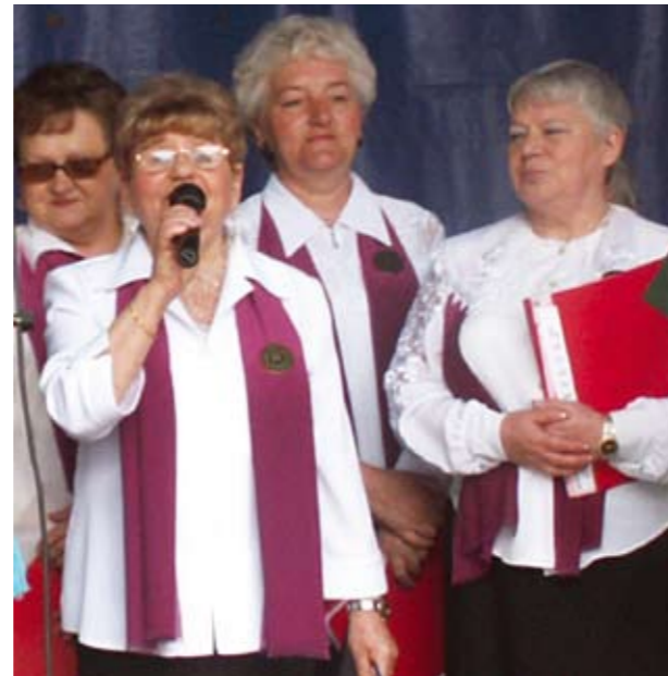
Jako pierwszy wystąpił zespół „Orfeusz” z piosenkami, które wszystkim szybko wpadały w ucho