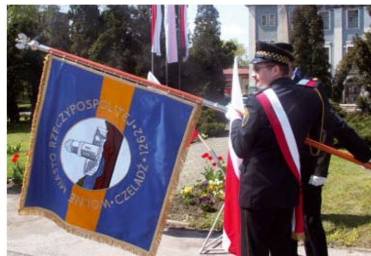
Miasto Czeladź ma swój sztandar.