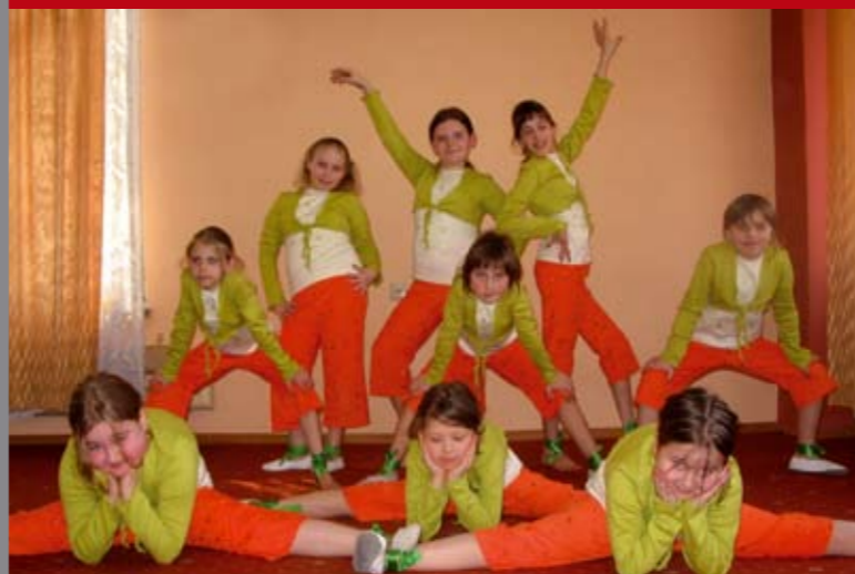
„Błysk” odniósł prawdziwy sukces.

Autorską prezentację zakończyły bisy, których domagała się oczarowana publiczność. Po nich nastąpił czas dyskusji i pytań. IC-G