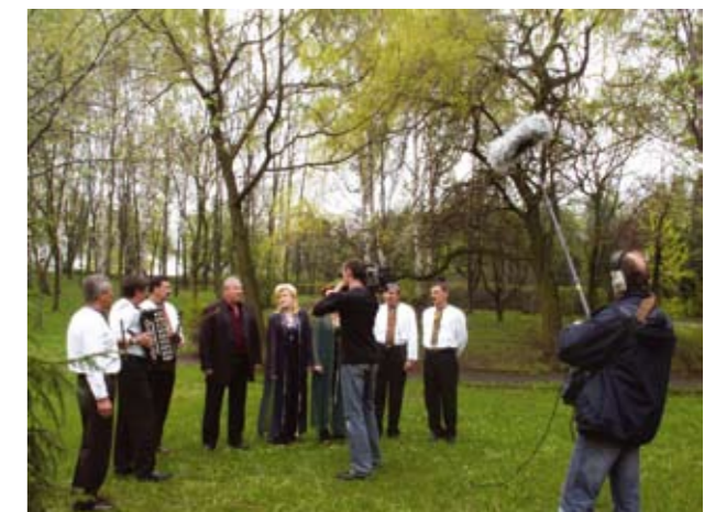
Telewizja Katowice w akcji – powstaje ujęcie z udziałem zespołu „Galuchany”

W tym roku rozpoczęliśmy nietypowo: inauguracja Dni Czeladzi odbyła się 30 KWIETNIA podczas festynu na osiedlu Nowotki, które obchodzi 55 lecie istnienia. I chyba był to strzał w dziesiątkę, bo mimo nie najlepszej pogody ulica 17 Lipca szybko zapelniła się uczestnikami zabawy.