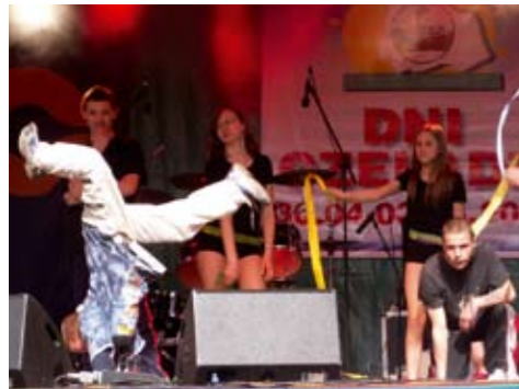
W parku Prochownia na Piaskach festyn z okazji Dni Czeladzi to już tradycja. Tańczą zespoły z MCSE na Piaskach