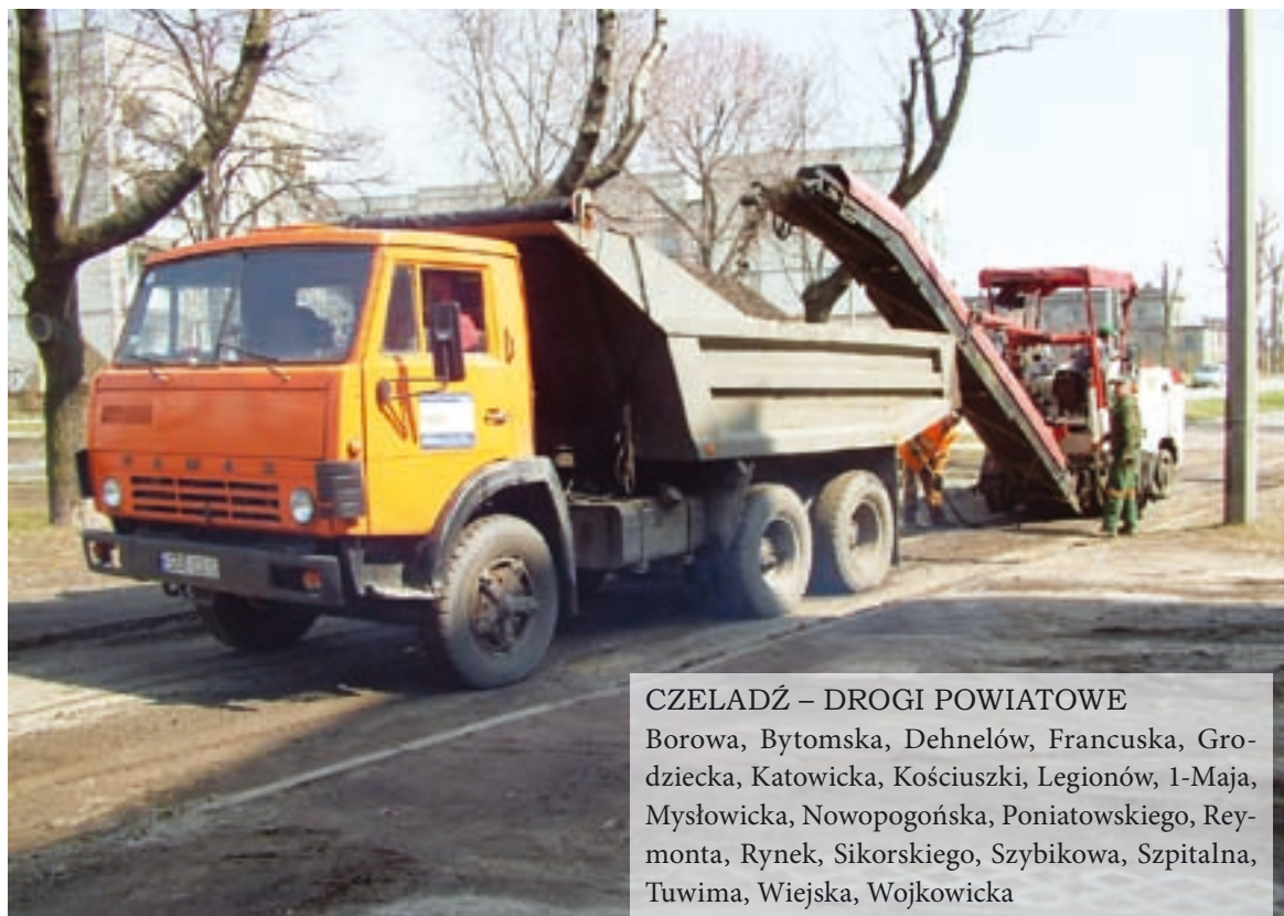
Czeladzki ZIK remontuje ulicę Spacerową