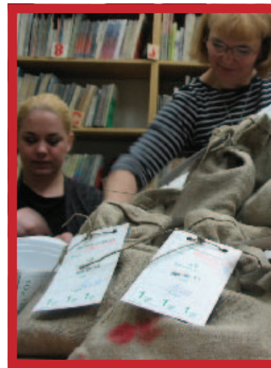
Sztab finansowy działał w Miejskiej Bibliotece Publicznej