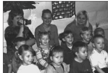
Na Mikołaja oczekiwały nie tylko dzieci...

z Krakowa pt. „Gdzie jest święty Mikołaj?”. Potem były prezenty – dzięki wsparciu i zaangażowaniu rodziców dzieci otrzymały pacz-