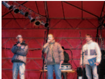
Konferansjerzy w akcji