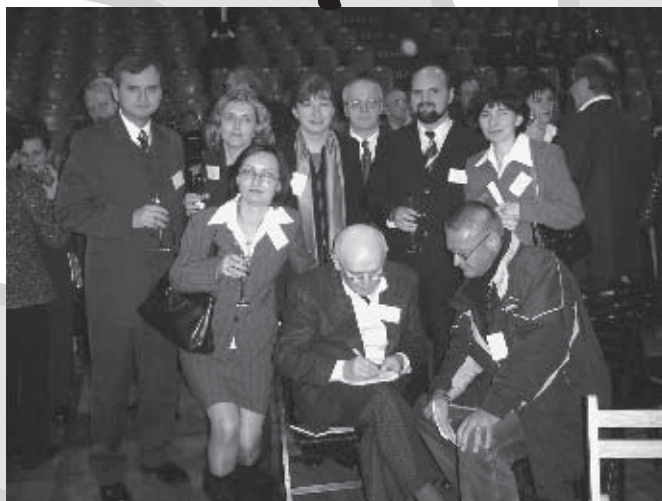
Profesor Adolf Czerny obiegany przez swoich wychowanków