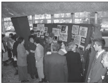
Wielu absolwentów odnajdywało się w szkolnych kronikach