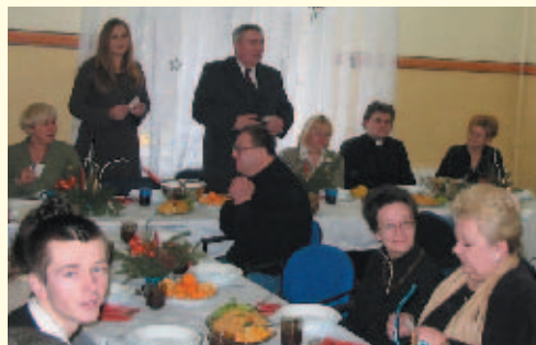
Wigilia to ważne wydarzenie również dla pensjonariuszy „Ostoj”