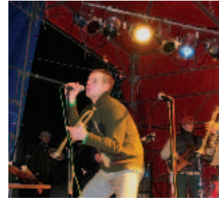
Granie „Konopiansów” rozgrzewało słuch