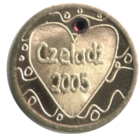
Moneta wybita w Czeladzi