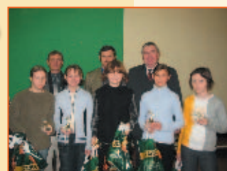
Upominki za prace plastyczne odebrał uczniowie SP 1.