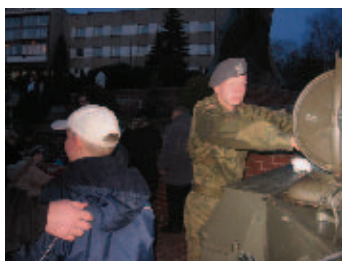
Wojskowa grochówka na rozgrzewkę