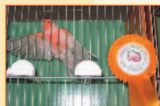
Zwycięskie ptaki honorowane były pięknymi kotylionami.

Firma KONSUL z Sosnowca, Firma ANIMAL z Sosnowca-Klimontowa, czeladzki GER-POL, COLUMBEX z Opola.