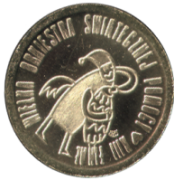
Czeladzi z okazji WOŚP