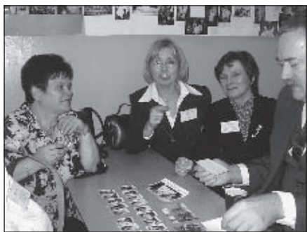
Wspomnieniom nie było końca