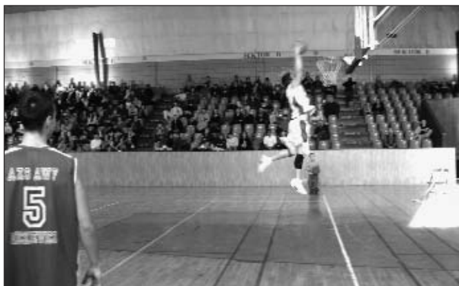
CKS 1924 — AZS AWF Mickiewicz 91:72