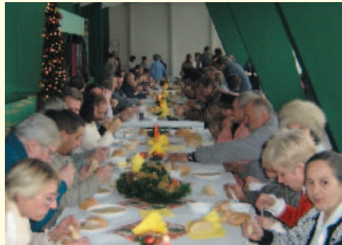
Po raz pierwszy zorganizowana została w mieście wigilia dla każdego.