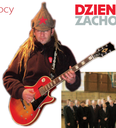
„Zaba” z „Konopiansów”