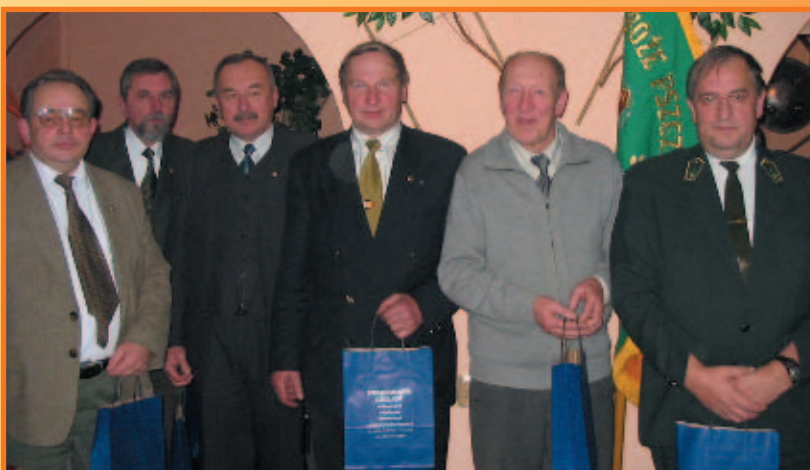
Zagłębiowscy pszczelarze i ich słowaccy przyjaciele.