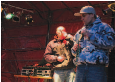
Jeden Osiem L – swoje przeboje śpiewali razem z widzami