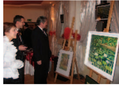
Kupić... nie kupić? – zastanawiali się uczestnicy Balu Charytatywnego