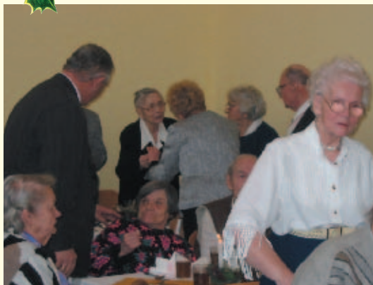
W „Seniorze” wszyscy życzyli sobie przede wszystkim dobrego zdrowia.