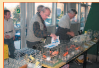
Gielda zaroila się od różnobarwnych kanarków. Można było kupić różne gatunki kanarków, karmę, klatki i przeróżne akcesoria służące hodowli