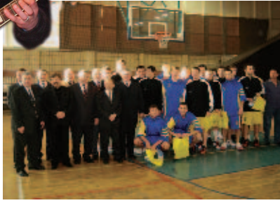
CKS 1924 wraz ze swoimi sponsorami i gośćmi włączył się do Wielkiego Grania (więcej na stronie 16)