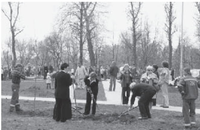
Każdy chciał posadzić chociaż jedno drzewo.

mów z zainteresowaniem przyglądali się temu przedsięwzięciu - nareszcie, za jakiś czas pod ich oknami wyrosną atrakcyjne drzewa, a zagospodarowany skwer będzie miejscem odpoczynku - chociażby po trudach zakupów w markecie.