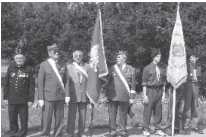
Harcerska zmiana warty – dwa pokolenia obok siebie