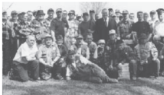
Na szczęście dla tak wielkiej grupy wędkarzy, na czeladzkim Przetoku ryb nie brakowało

Fenomen „Boczka” – Górnik Piaski zwyciężcą eliminacji do Pucharu Polski Podokręgu Sosnowieckiego! Górnik Piaski – AKS Niwka 4-0