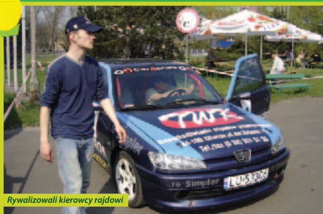
Rywalizowali kierowcy rajdowi