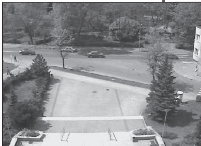
Zdjęcie z kamery internetowej umieszczonej na frontonie Urzędu Miasta