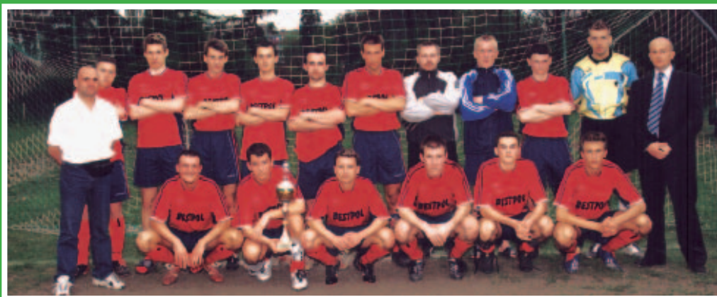
(O zwycięskim meczu czytaj na stronie obok)