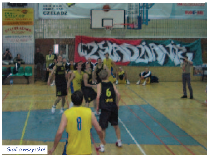
Grali o wszystko!