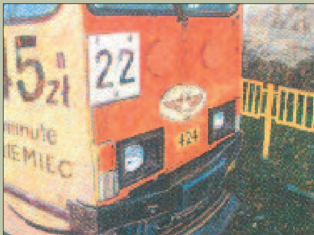
Paweł Juszcak, Tramwaj, III nagroda