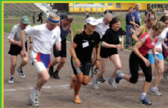
Patera „Dziennika Zachodniego” dla TKKF Saturn