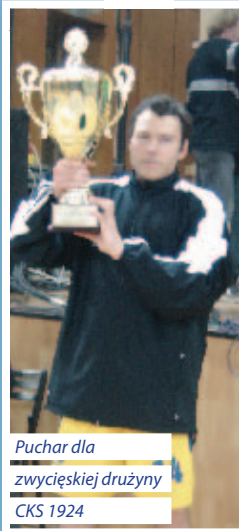
Puchar dla zwyciężskiej drużyny CKS 1924