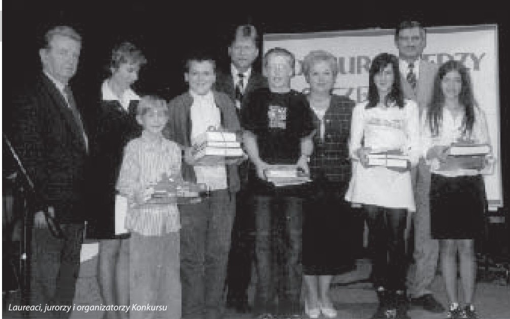
Laureaci, jurorzy i organizatorzy Konkursu