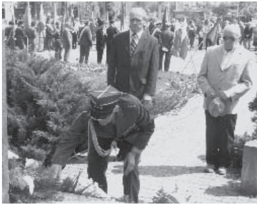
Pod obeliskiem na placu Konstytucji

T egoroczne Święto Konstytucji 3 Maja upłynęło pod znakiem refleksji o dwóch ważkich wydarzeniach, dotyczących naszego kraju: to pierwsza rocznica przystąpienia Polski do Unii Europejskiej oraz powrót pamięcią do jakże symptomatycznych wypowiedzi Jana Pawła II o Polsce w Unii i o Europie.