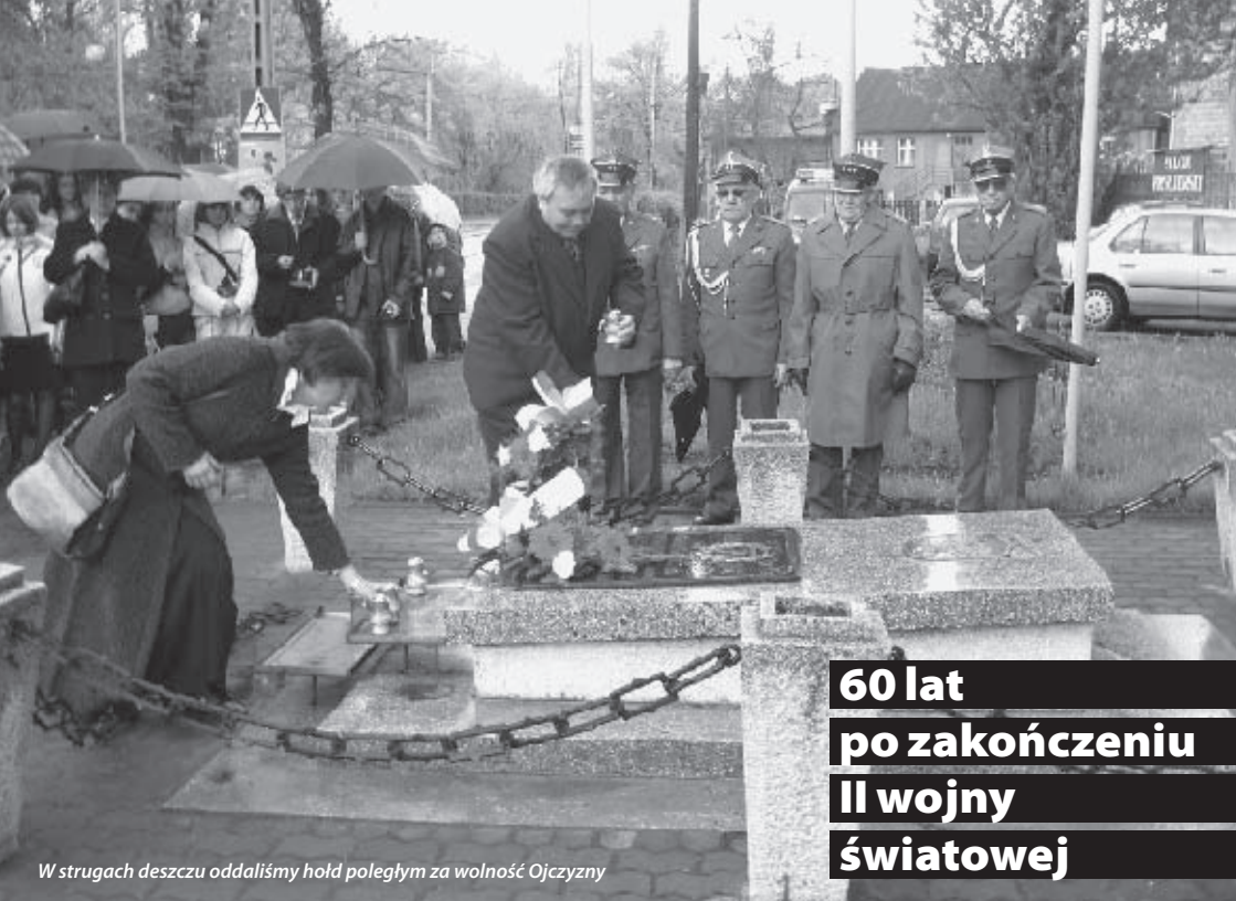
W strugach deszczu oddaliśmy hołd poległym za wolność Ojczyzny

60 lat po zakończeniu II wojny światowej