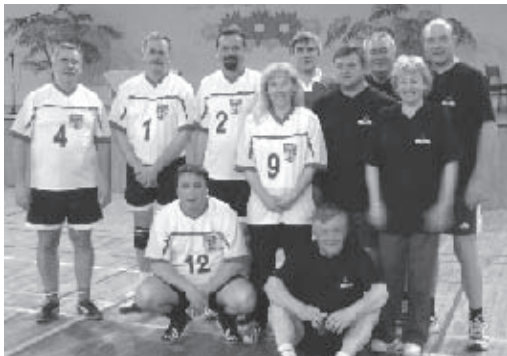
Siatkarska drużyna VIP-ów

W Miejskim Ośrodku Sportu i Rekreacji Dni Czeladzi 2005 zaczęły się już 28 kwietnia. Po raz szósty spotkali się radni i pracownicy samorządowi miast i gmin powiatu będzińskiego, aby rozegrać turniej siatkówki . Wśród drużyn zaproszonych byli: drużyna Urzędu Miejskiego z Dąbrowy Górniczej, Urzędu Miejskiego z Będzina i Urzędu Miasta Czeladź. I miejsce i Puchar Burmistrza Miasta Czeladź zdobyli reprezentanci Urzędu