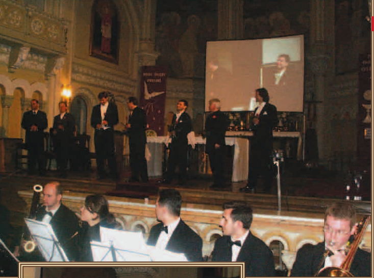
Turniejowi Tenorów towarzyszyła orkiestra AM w Katowicach