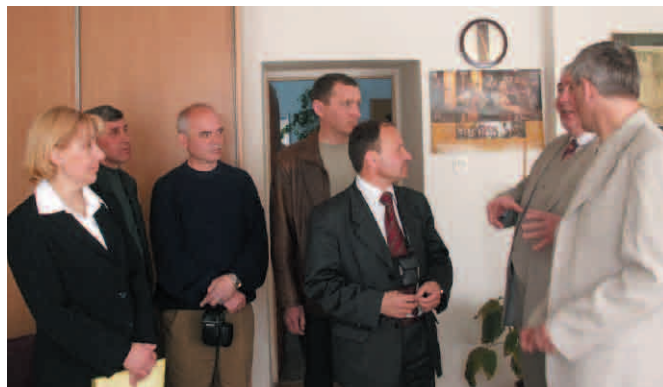
Goście z Żydaczowa podczas zwiedzania Urzędu Miasta.