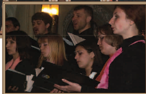
Lwowska „Gloria” zachwyciła precyzją wykonania