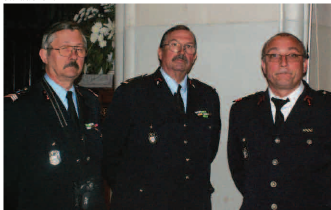
Francuscy strażacy w pełnej gali

W dniach 12-19 maja br. z wizytą do Czeladzi przyjechały dwie delegacje strażaków – z Francji i Ukrainy. Zasadniczym celem wizyty było nawiązanie współpracy między jednostkami Ochotniczych Straży Pożarnych z Czeladzi, Auby i Żydaczowa oraz wzajemna wymiana doświadczeń.