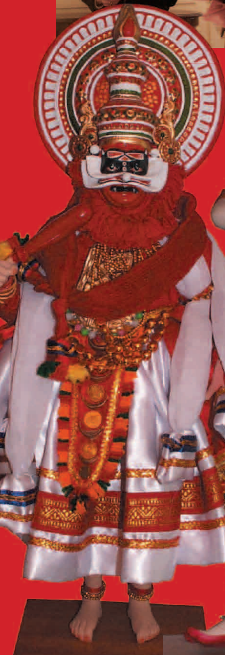
Krishna – pozytywny bohater dramatu tancerzynie Kathakali.