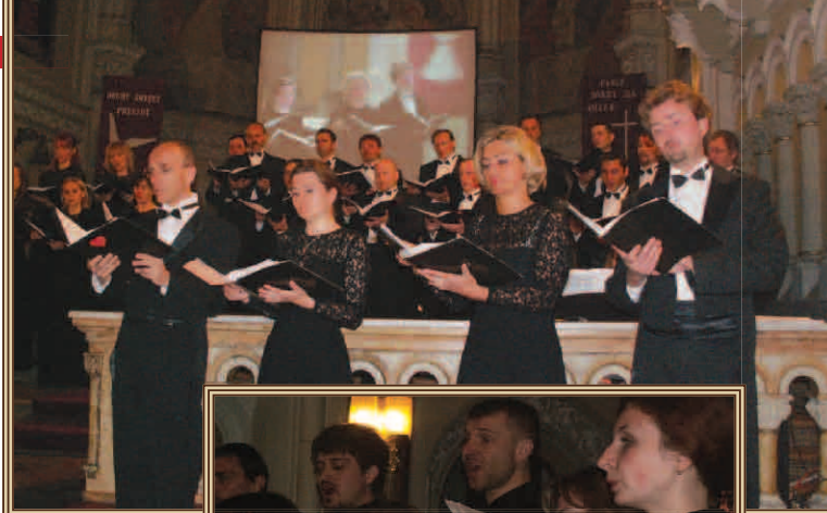
Chór Opery Dolnośląskiej z Wrocławia dał popisowy występ