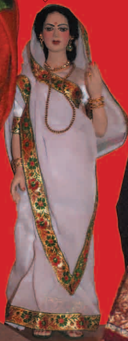
Tancerka Bharata Natyam