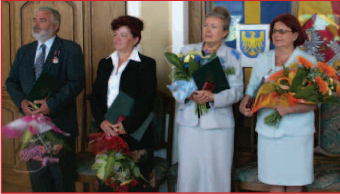
Laureaci medalu „Za wkład w rozwój miasta Czeladzi”.