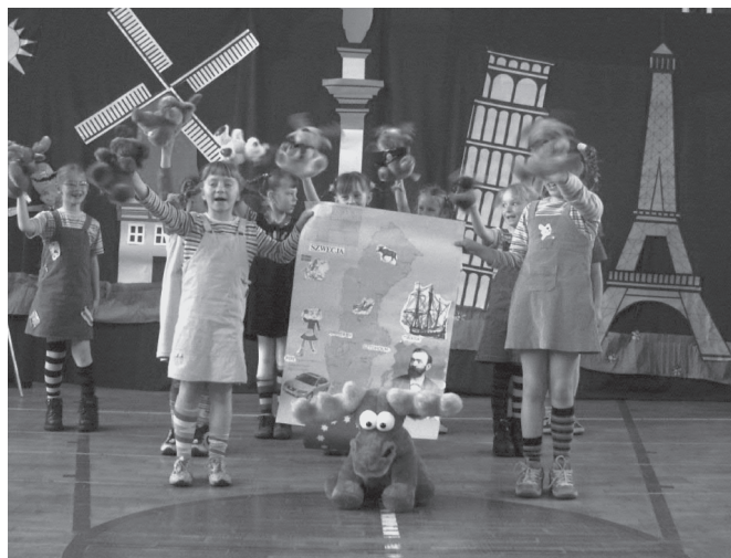
W występy wszyscy włożyli sporo pracy i serca.