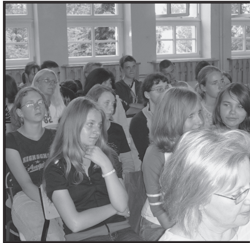
Młodzież „dwójki” z uwagą słuchała wykładu.