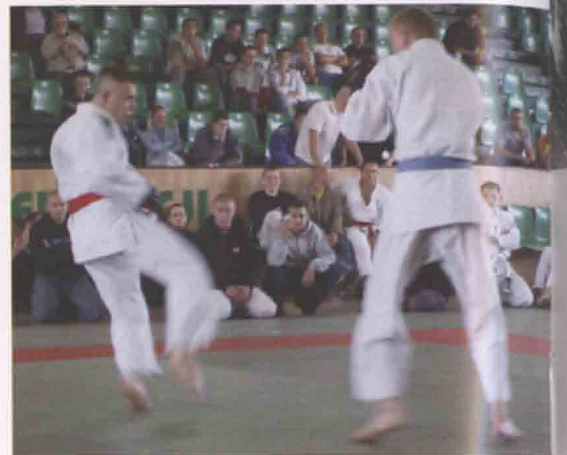
Kibice dopingowali zacięte finałowe walki.