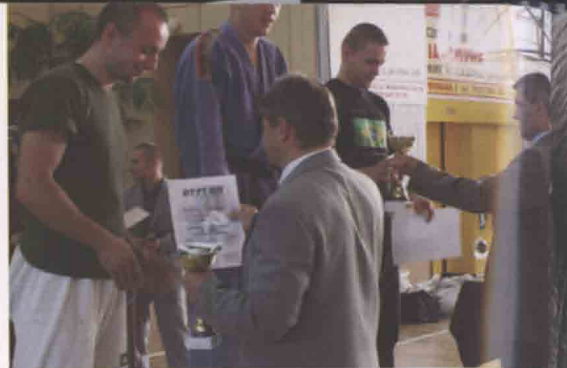
Na najwyższym podium reprezentant Rosji, ale w towarzystwie zawodników z katowickiego AZS.

Turniej w Czeladzi był jednym z czterech zaliczanych do klasyfikacji Pucharu Polski. (k)