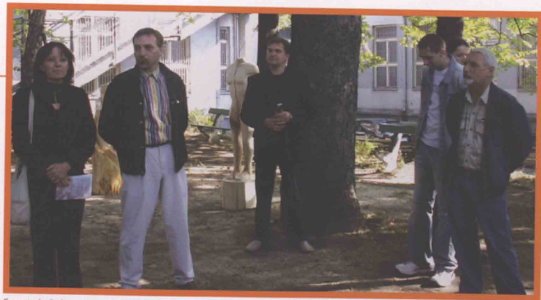
Grupa twórców i organizatorów podczas zakończenia warsztatów