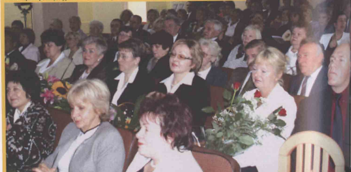
Miłośnicy książek i przyjaciele czeladzkiej MBP stawili się w komplecie.

Wrześniowe wybory parlamentarne przyniosły spore zmiany na zagłębiowskiej scenie politycznej. Dotychczasowy sejmowy potentat Sojusz Lewicy Demokratycznej utracił prymat na rzecz Platformy Obywatelskiej. Wyborcy przestali wierzyć w lewicowe „gruszki na wierzbie” i oddali ster w ręce racjonalnej prawicy. Co ciekawe, również w Senacie Sojusz stracił, i to wszystko. Oba miejsca podzielili między siebie reprezentanci PO i PiS.