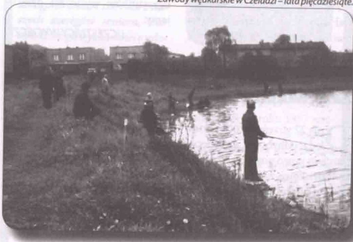
Zawody wędkarskie w Czeladzi – lata pięćdziesiąte.