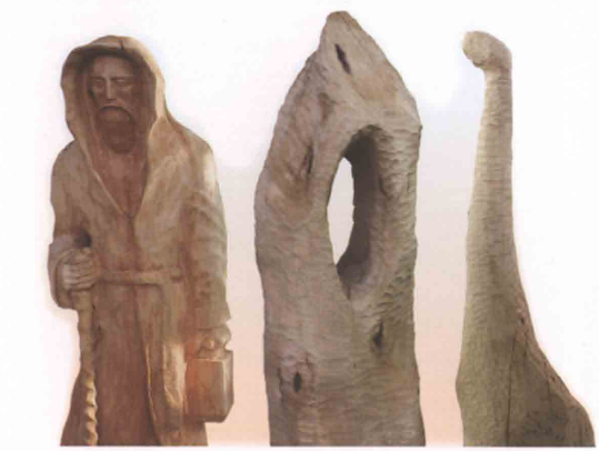
Rzeźby wykonane podczas pleneru zgłoszycy w galerii „Elektrownia”