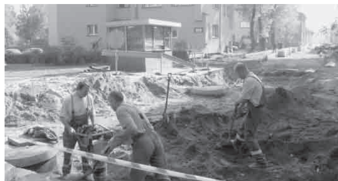
Prace przy modernizacji ul. 21 Listopada ZIK prowadzi pełną parą

Zintegrowany Program Operacyjny Rozwoju Regionalnego poza możliwo-