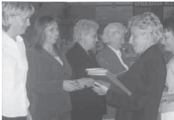
Wyróżnienia za dobrą pracę otrzymało wielu nauczycieli z czeladzkich szkół

stra Zbigniewa Szaleńca , przedstawicieli Kuratorium Oświaty, Wydziału Edukacji, dyrektorów placówek oświatowych, emerytów i rencistów oraz wszystkich związkowców. Podczas uroczystości wygłoszono referat okolicznościowy przypominający historię związku w Czeladzi, nagrodzono zasłużonych działaczy medalem okolicznościowym