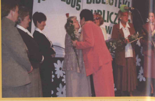
Czerwone róże dla bibliotekarek, które książki poświęciły wiele lat pracy zawodowej.