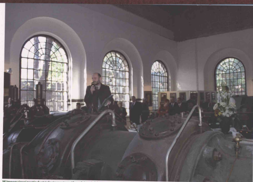
W imponującej postindustrialnej przestrzeni kopalnianej elektrowni znalazła miejsce Miejska Galeria Sztuki Współczesnej „Elektrownia”