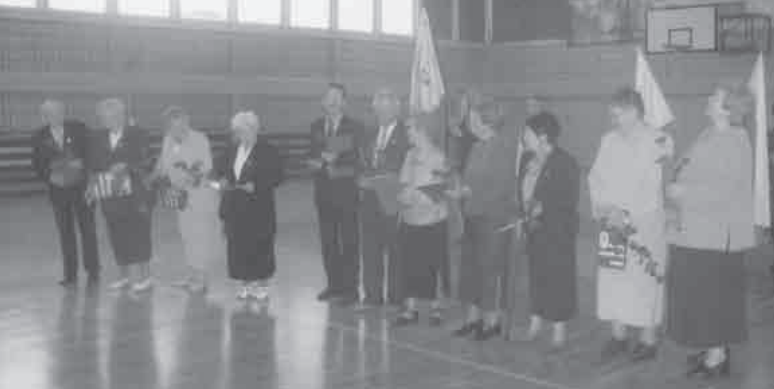
Podczas uroczystości oficjalnej podziękowania złożono nauczycielom – seniorom, członkom Związku