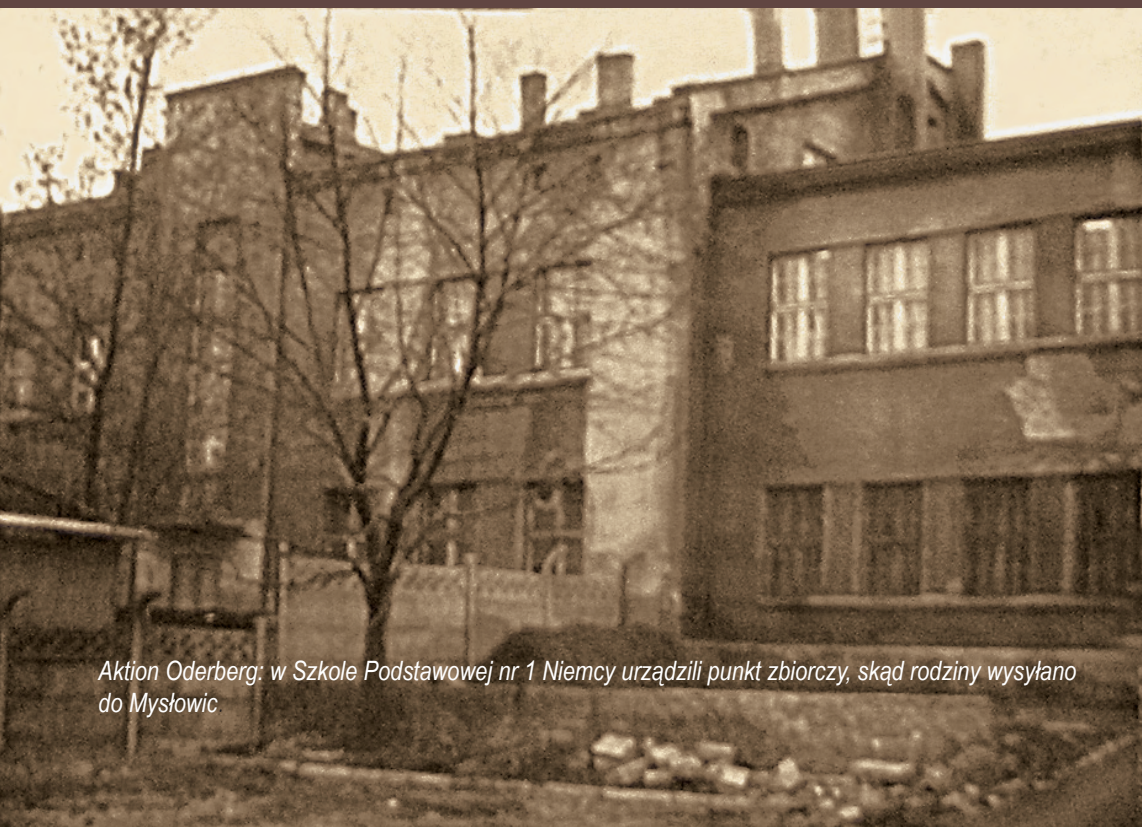
Aktion Oderberg: w Szkole Podstawowej nr 1 Niemcy urządzili punkt zbiorczy, skąd rodziny wysyłano do Mysłów