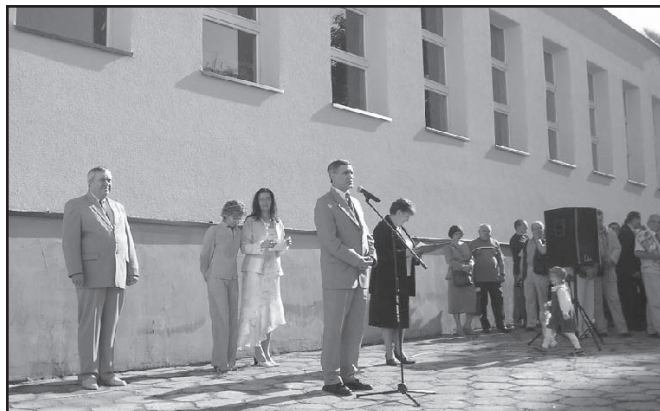
Inauguracja Miejskiego Zespołu Szkół