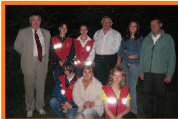
Grupa z Żydaczowa w drodze na Jasną Górę