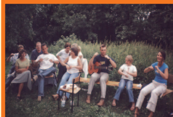
Na pikniku w Czeladzi