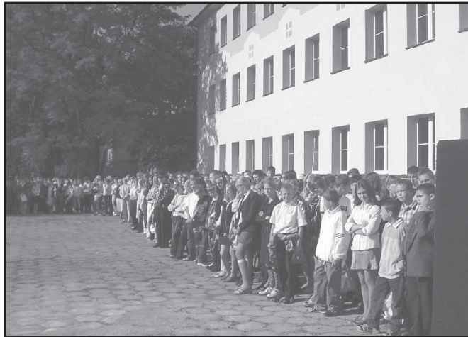
Znów wśród kolegów i koleżanek - tylko o rok starsi...