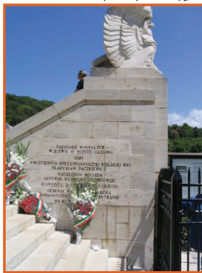
Orły strzegące cmentarza pod Monte Cassino

go pobytu na Monte Cassino. Pan Gwiazda odwiedził również inne, pobliskie cmentarze: w San Lorento, Anconie i Monte Cassino, gdzie spoczywają polscy żołnierze walczący w tym czasie we Włoszech.