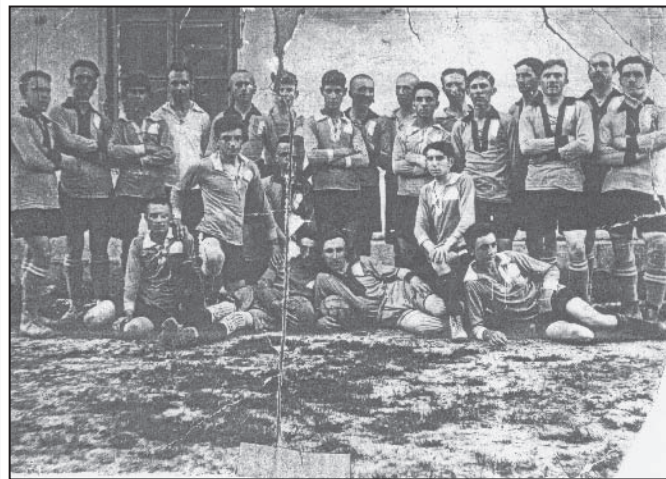
KS Gwiazda, Piaski, 1927

Wśród mieszkańców Piasków początek zainteresowania sportem datuje się od czasów sprzed I wojny światowej. Już w 1913 powstają pierwsze grupy sportowe, uprawiające piłkę nożną, krykiet oraz palant . Dopiero jednak w 1922 r., z inicjaty-