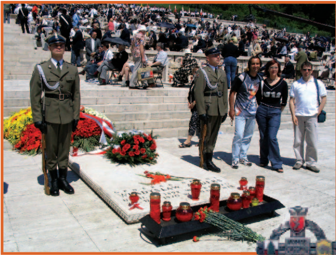
Warta przy grobie generała Władysława Andersa