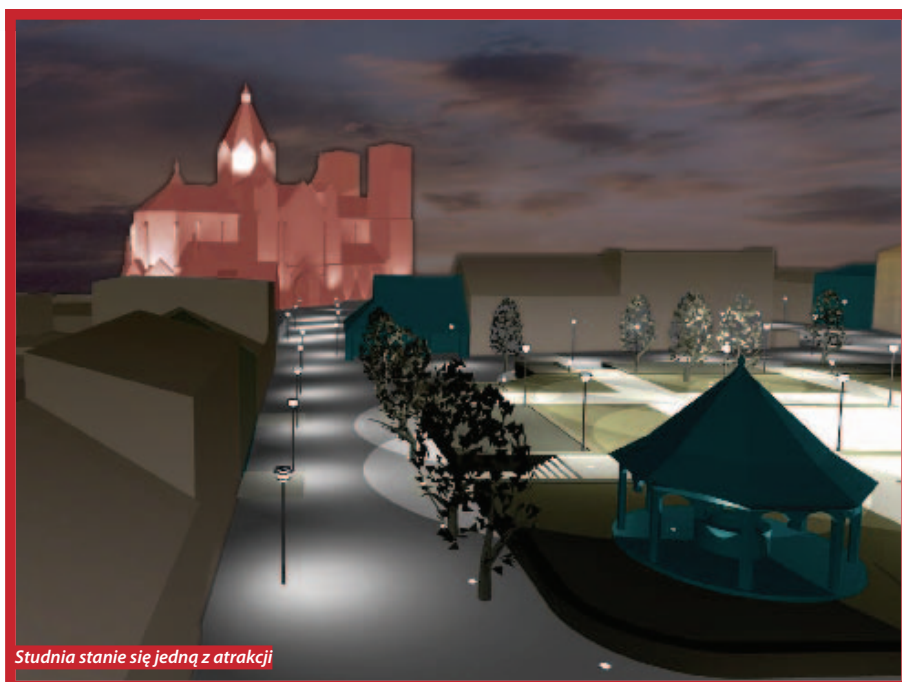
Studnia stanie się jedną z atrakcji

Wizualizacja komputerowa opracowana przez pracowników naukowych Politechniki Krakowskiej