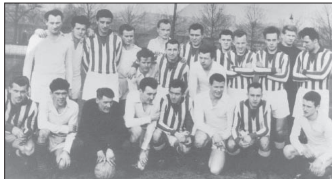
Po meczu Polonii Bytom z Brynicą (w białych strojach)