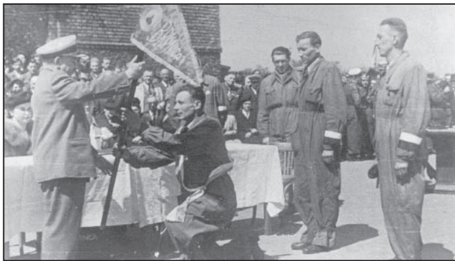
Poświęcenie proporca KS Brynica