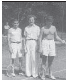
Tenisści też odnosili sukcesy