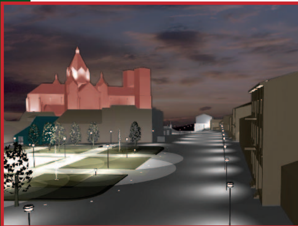
Stare Miasto stanie się prawdziwym centrum

nieruchomości oraz mieszkańców rejonu staromiejskiego. Warto nadmienić, że od ponad roku trwają intensywne prace projektowe w trzech obszarach. Pierwszym z nich jest koncepcja architektoniczno-urbanistyczna, przygotowywana przez pracowników Politechniki Krakowskiej. Zakłada ona przebudowę płyty Rynku wraz z rekompozycją zieleni, uzupełnienie brakującej zabudowy, wzbogacenie przestrzeni publicznej o elementy małej architektury, a także częściową odbudowę szesnastowiecznych fortyfikacji miejskich.