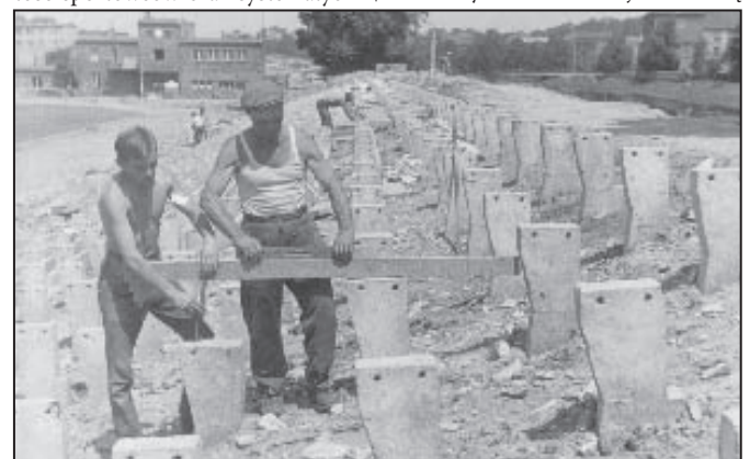
Tak powstawał stadion

ki dzisiejszego jubilata. 80 lat to dla człowieka długie, spełnione życie ale i w życiu organizacji to także niemało. Niewiele jest w naszym mieście instytucji równie leciwych, które oparły się pożogom wojennym, nieprzyjnym losom czy po prostu kłopotom finansowym. Tym bardziej trudno przecenić sportowy dorobek i rolę CKS-u, jaką odegrał w życiu Czeladzi. Spopularyzował