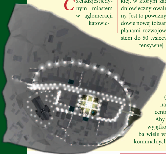
Unikatem jest owalnicowy układ rynku

Aby jednak wyeksponować wyjątkowość tego miejsca potrzeba wiele wysiłku, zarówno instytucji komunalnych, jaki i samych właścicieli