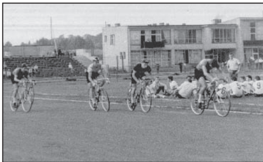
W przerwie meczu wyścig kolarski

W roku 2002 CKS praktycznie przestał działać. Sport w mieście przejął MOSiR-CKS i TKKF. Z inicjatywy Andrzeja Mentla i zastępcy burmistrza Zbigniewa Szaleńca