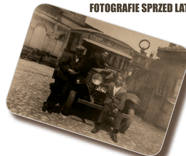
Przystanek przy kopalni „Saturn” – ulica Dehnelów.