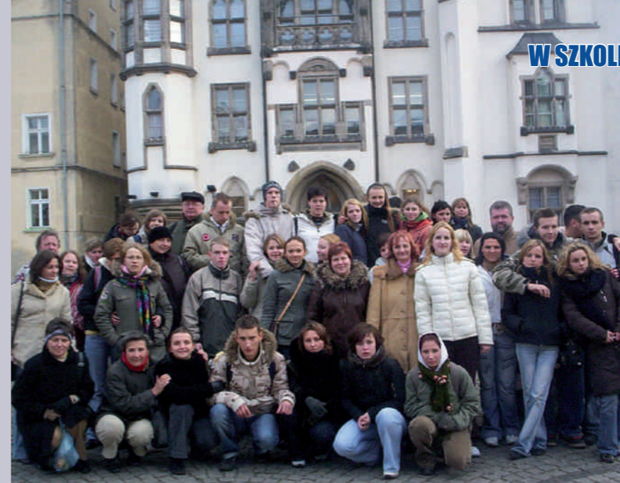
Grupa „Comeniusa” na wrocławskim rynku.