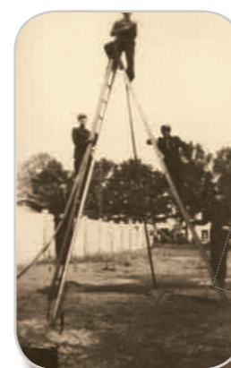
◀Ćwiczenia kopalnianych strażaków.