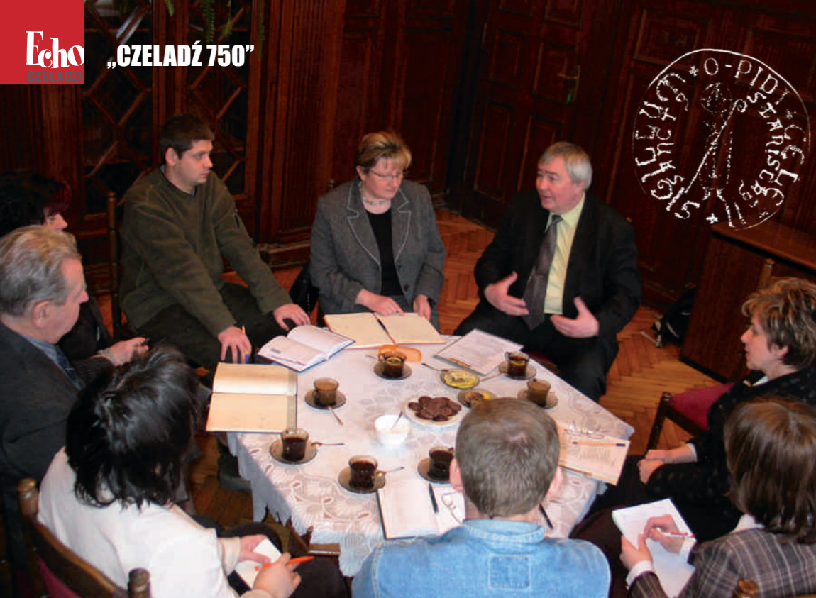
W pałacu „Pod filarami” odbyło się pierwsze spotkanie Komitetu „Czeladź 750”