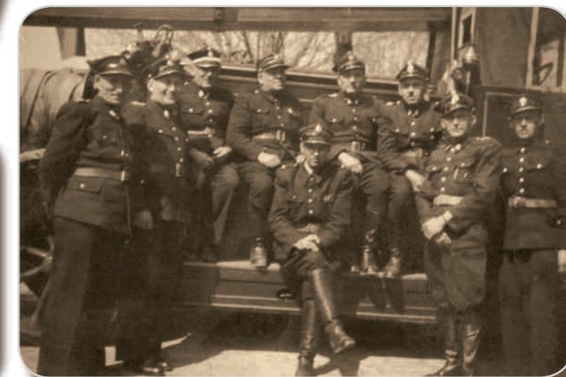
▼Drużyna straży pożarnej kopalni „Saturn”.

de wszystkim osoby a nie architektura, a wykonywanie zdjęć, często specjalnie pozowanych (nawet w plenerze) było nie lada wydarzeniem, to gdzieś w tle zawsze zauważyć można zabudowania miejskie czy przemysłowe – jak na zdjęciach (lata 30. XX w), które udostępnił nam pan Edward Lisek.