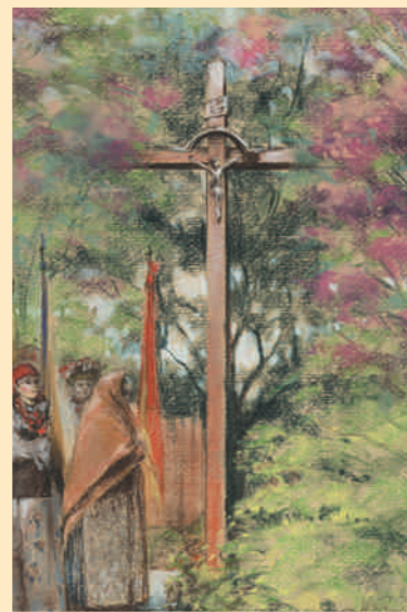
Teresa Strojniak, Boże Ciało, pastel, 2005