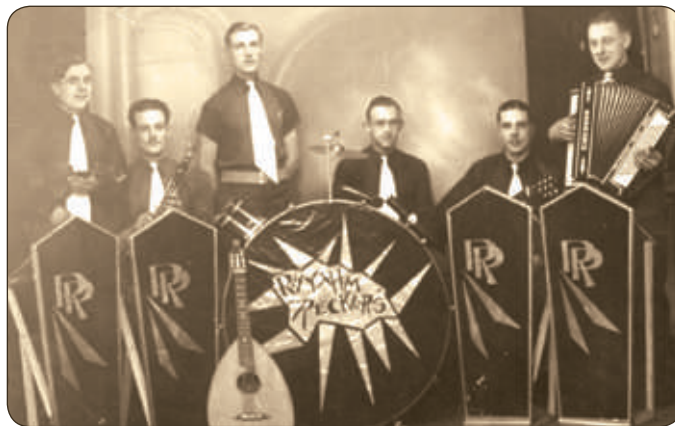
Na zdjęciu przesłanym z Anglii trzeci z lewej to jeden z angielskich jeńców uratowanych przez czeladzian.