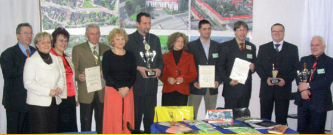
Laureaci nagród w towarzystwie organizatorów II Targów Budownictwa.

Druaga edycja Targów Budownictwa cieszyła się jeszcze większym zainteresowaniem niż edycja ubiegłoroczna. Sprawiała to zapewne bogatsza i bardziej urozmaicona oferta.