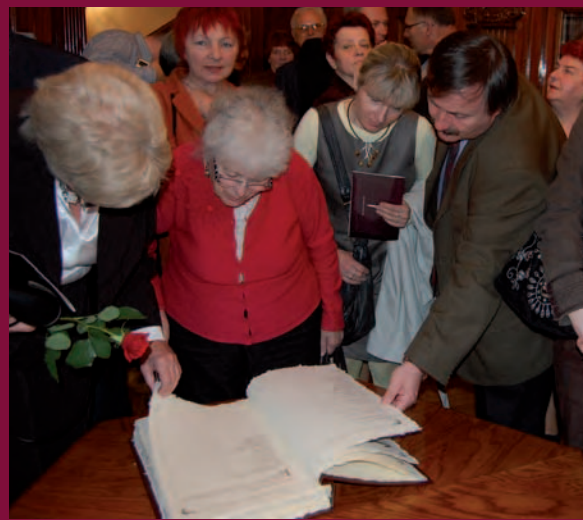
Kronika Miasta Czeladź cieszyła się ogromnym zainteresowaniem. ▶