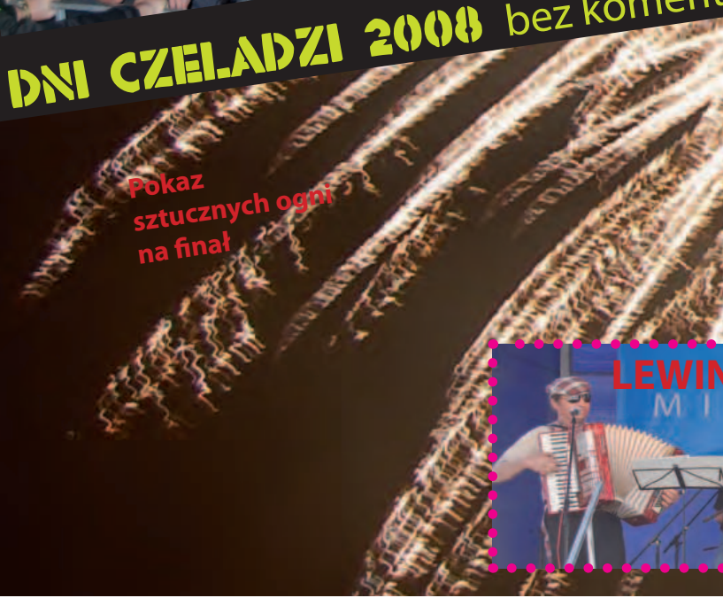
Pokaz sztucznych ogni na finał

DNI CZELADZI 2008 bez komentarza ... DNI CZELADZI 2008 be