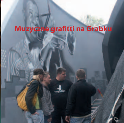
Muzyczne grafitti na Grabku