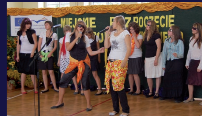
Ostatki lata, wspomnienie wakacji a także szkolne dowcipy i scenki rodzajowe – o tym wszystkim opowiedziały uczennice z Gimnazjum nr 2 w przygotowanym programie artystycznym.