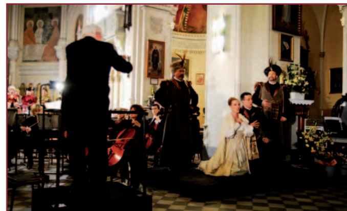
W operowym nastroju podczas tegorocznego Festiwalu Ave Maria.