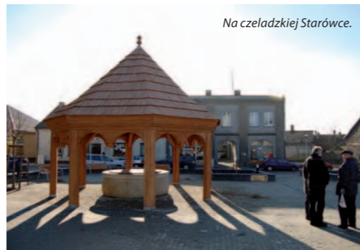
Na czeladzkiej Starówce.

- Jak wygląda sytuacja w tzw. Wschodniej Strefie Ekonomicznej czyli rejonie centrum M1, po sukcesach z końca lat dziewięć-