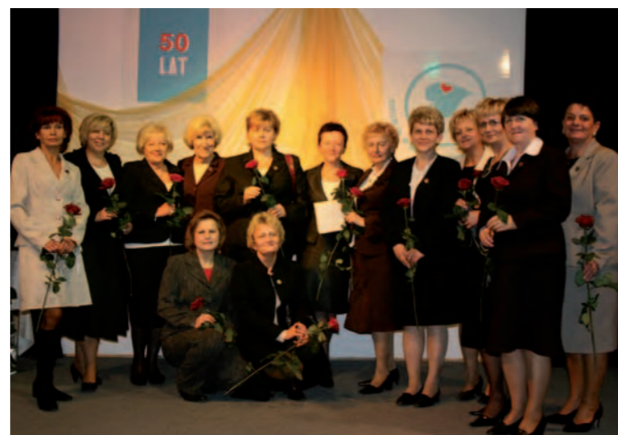
Podczas uroczystości uhonorowane zostały również pielęgniarki.