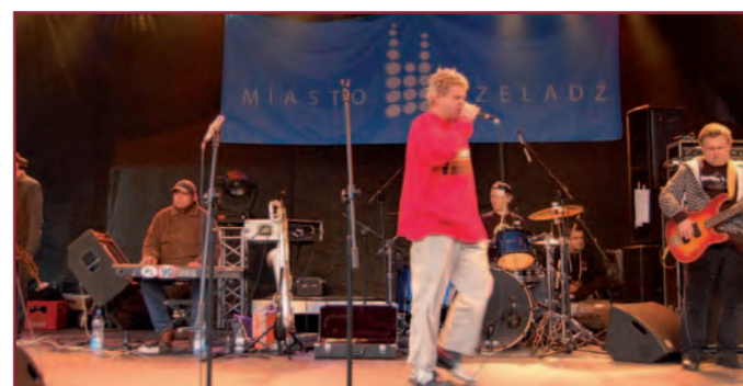
Dni Czeladzi 2008 – koncert Kultu i Kazika