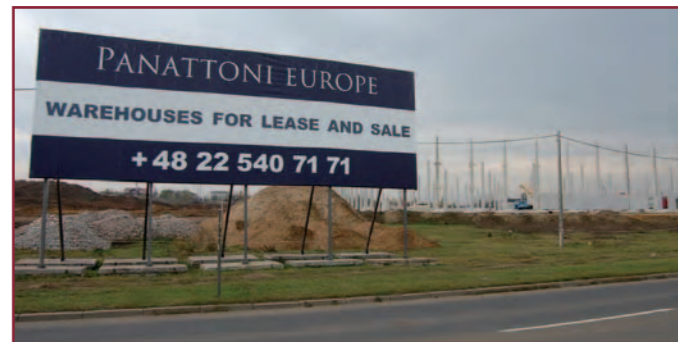
Panattoni buduje przy ulicy Wiejskiej.