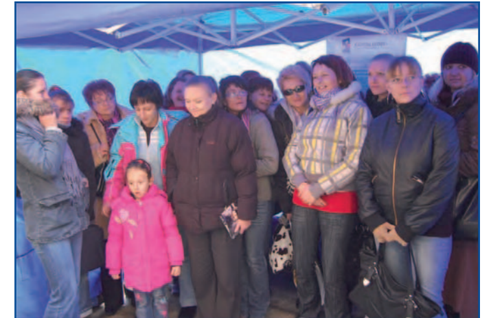
Grupa absolwentów pierwszej edycji unijnego programu.