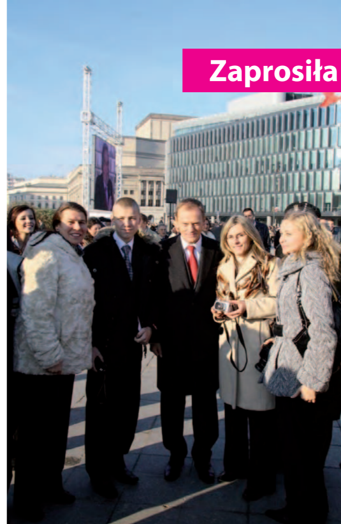
Premier Donald Tusk w otoczeniu młodzieży z Zespołu Szkół nr 1