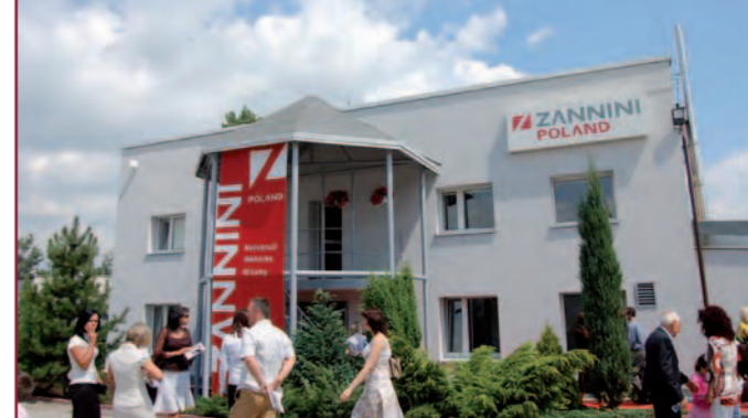
Przy ulicy Wojkowickiej swą siedzibę ma firma Zannini.