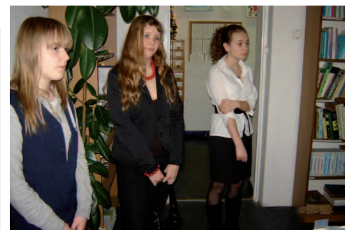
Laureatki konkursu plastycznego.