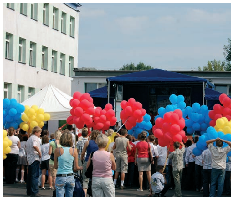
To był ważny dzień w życiu „siódemki” – na uroczystość przybyło grono znakomitych gości.