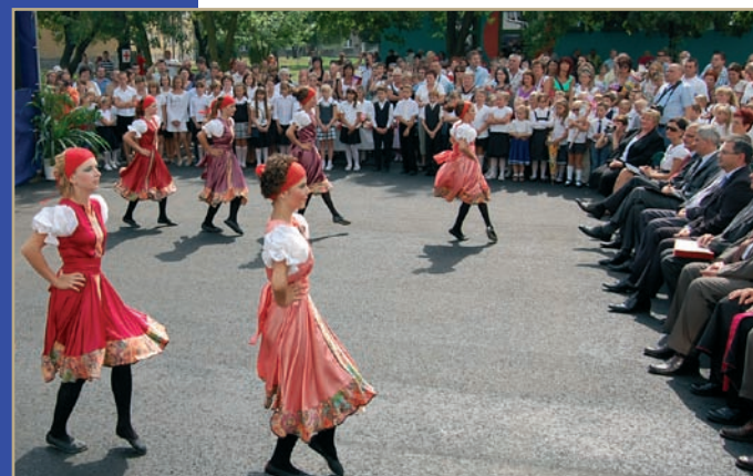
Uczniowie przygotowali bogaty program artystyczny.