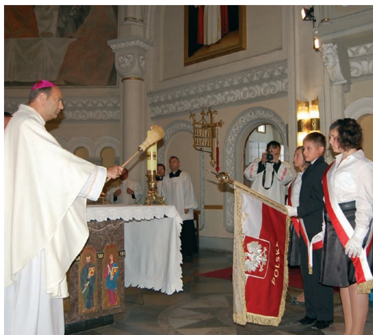
Poświęcenie sztandaru Szkoły Podstawowej nr 7 przez ks. bp. Grzegorza Kaszaka, ordynariusza diecezji sosnowieckiej.