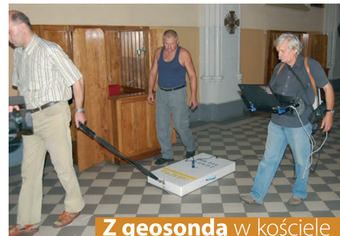
Z geosondą w kościele

27 sierpnia 2009 na terenie przykościelnym oraz w kościele pw. św. Stanisława BM przeprowadzane zostały przez Zakład Badań Nieniszczących z Krakowa badania przy pomocy geosondy. Mają one pokazać przebieg murów oraz ewentualnych zabudowań w tym rejonie.