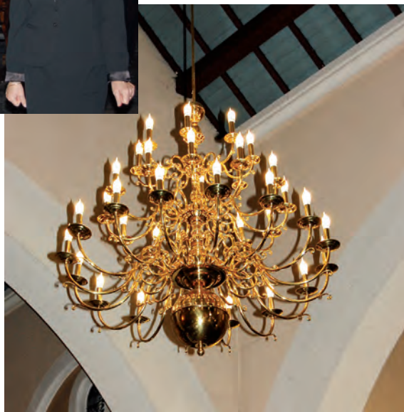
Nawę główną i nawy boczne rozświetliły nowe żyrandole.