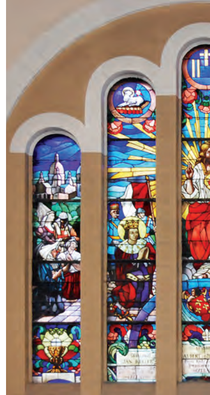
Zabytkowy witraż ufundowany przez Zarządców

Uroczysta Msza św. poprzedził koncert Śląskiego Chóru Górniczego „Polonia – Harmonia”.