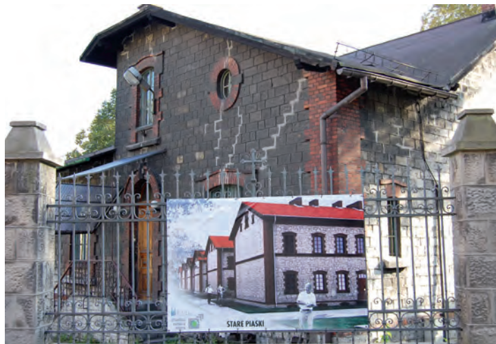
Parkan wokół kościoła ozdobiły wizualizacje Nowych Piasków.