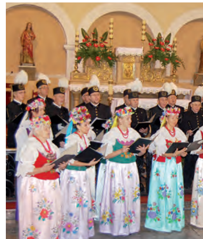
Koncertował Śląski Chór „Polonia