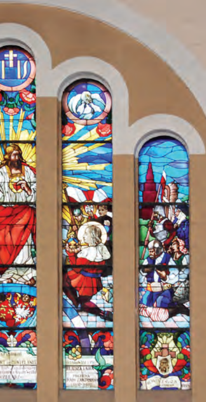
Wnętrze kościoła i pracownicy kopalni 'Czeladź, pocz. XX w.