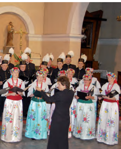
„Gonia Harmonia” z Piekar Śląskich.