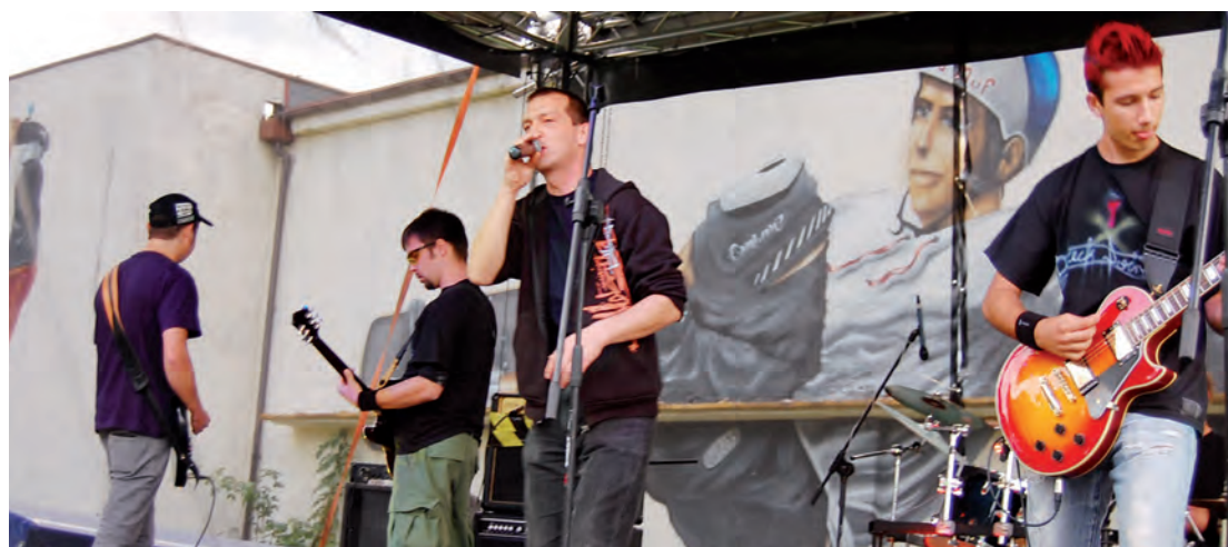
Przed „Traffikiem” odbywał się jubileuszowy festyn.