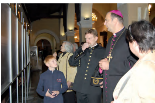
Wystawa archiwalnych zdjęć Piasków w kościele MBB.