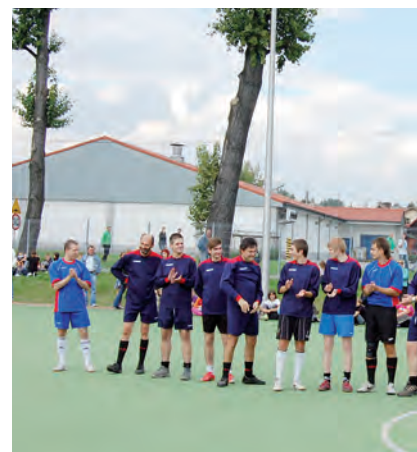
Za chwilę rozpocznie się mecz między pa