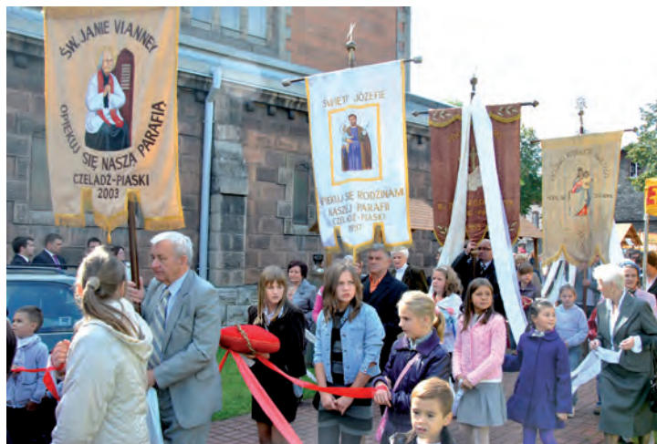
Procesja z okazji uroczystości odpustowych w parafii MBB.