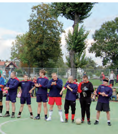
Festyn parafii św. Archaniołów i parafii MBB.