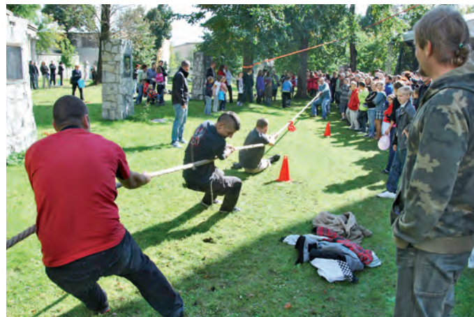
Festyn rodzinny dostarczył różnorodnych atrakcji dla dużych i ... małych.