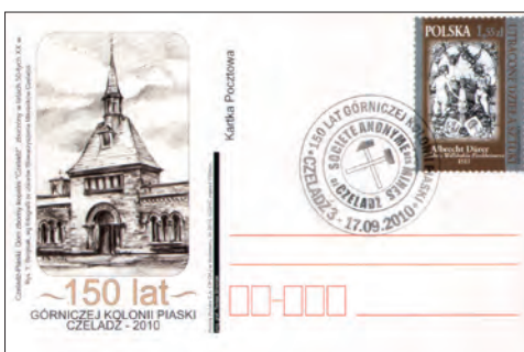
Karta pocztowa wydana z okazji 150-lecia Piasków.