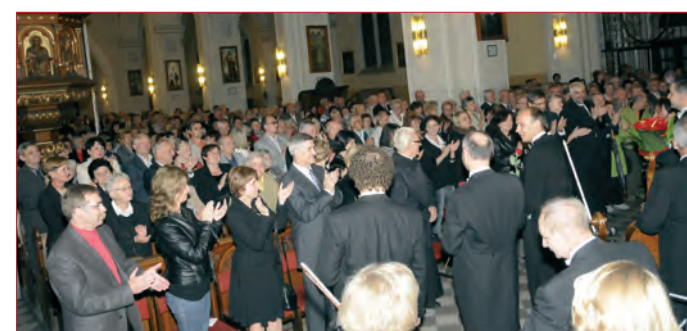
Turniej Tenorów cieszy się zawsze ogromnym zainteresowaniem melomanów.