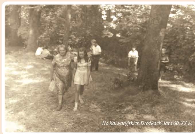
Na Kalwaryjskich Dróżkach, lata 60. XX w.