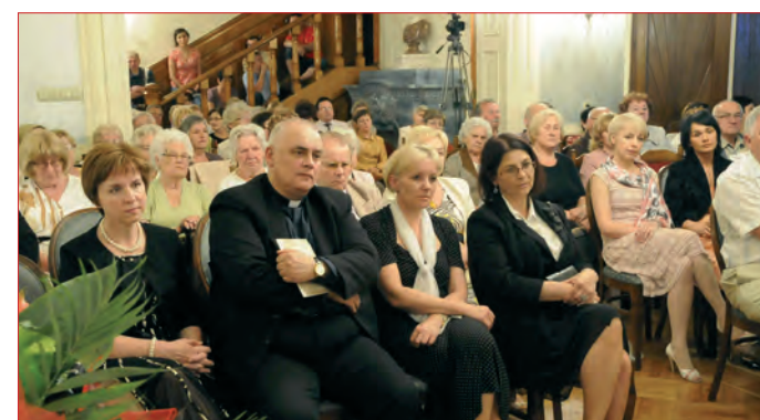
Drugi dzień festiwalu mimo iż przebiegał w kameralnej atmosferze Muzeum Saturn, cieszył się wielkim zainteresowaniem melomanów.