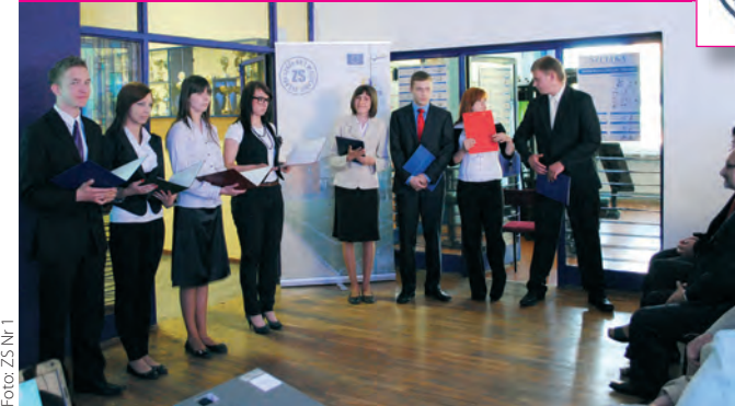
Prezentacja fotobloga i wystawy we własnej szkole.