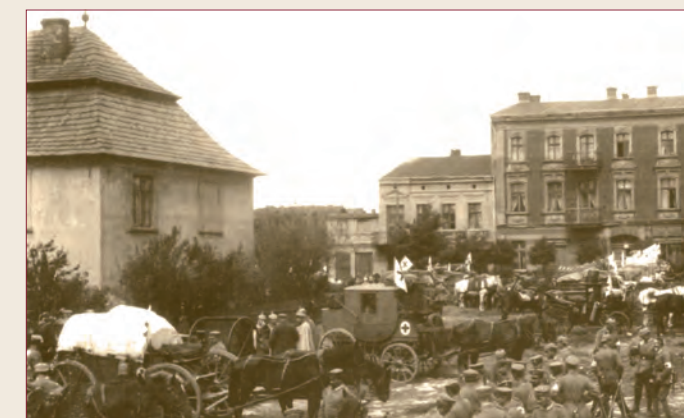
Czeladzki Rynek w 1914 r., w głębi kamienice będące dziś własnością komunalną.

zwalających przyciągnąć uwagę mieszkańców. Większość usytuowanych tu budynków stanowi, co prawda, własność prywatną i wygląd ich jest zależny wyłącznie od posiadanych przez właścicieli środków finansowych, ale