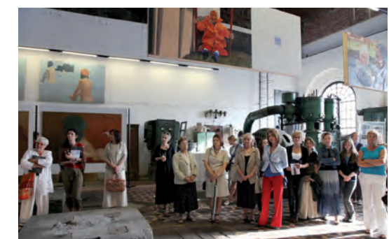
Sprzyjająca pogoda sprawiła, że goście wernisażu dopisali...