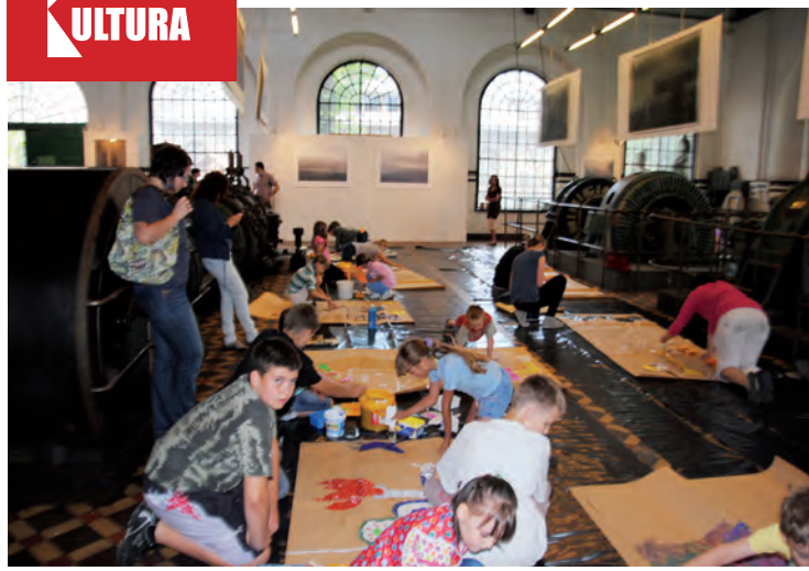
Dużą frajdą było malowanie zobotów.