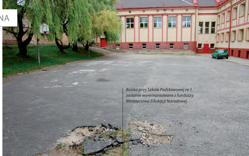
Boisko przy Szkole Podstawowej nr 1 zostanie wyremontowane z funduszy Ministerstwa Edukacji Narodowej.