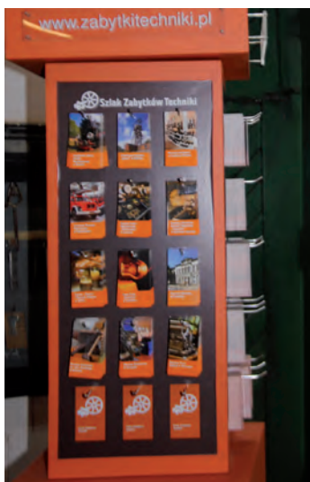
Tuż przed Industriadą do „Elektrowni” trafiły batfany i stojaki z wizytówkami obiektów Szlaku Zabytków Techniki.