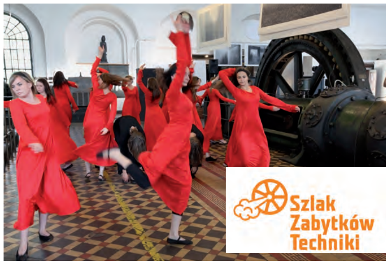
Misz-Masz w „industriadowym” tańcu.