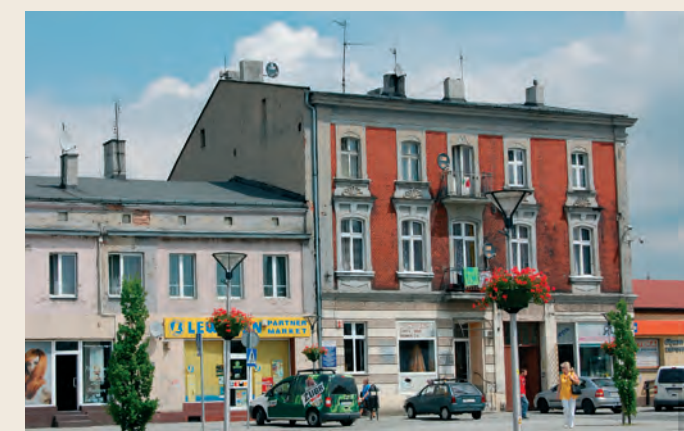
Rynek, kamienice nr 26 i 28.

Rynek jest wizytówką miasta, a jego wizerunek i atmosfera powinna sprzyjać na co dzień rozwojowi życia lokalnego biznesu, a w wolnym czasie spotkaniom i wypoczynkowi mieszkańców.