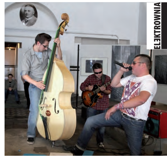
Rytmy boogie-woogie dodały imprezie jeszcze większej dynamiki.