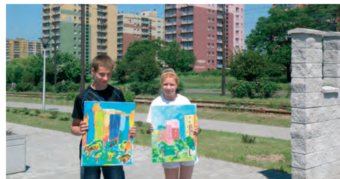
Podczas pleneru malarskiego Stowarzyszenie Osób na Rzecz Osób Niepełnosprawnych „Familia” zaprosiło do współpracy ŚDS „Ostoja” w Czeladzi, Warsztaty Terapii Zajęciowej z Będzina-Lagiszy, Ośrodek Wsparcia z Sosnowca, Zespół Szkół Specjalnych w Czeladzi i Specjalny Ośrodek Szkolno-Wychowawczy w Będzinie.

Nowe treningowe boisko sportowe już otwarte . Realizacja zadania była zagrożona z powodu braków finansowych. Ale dzięki interwencjom w Urzędzie Marszałkowskim udało nam się zmienić proporcje dofinansowania z funduszy unijnych.