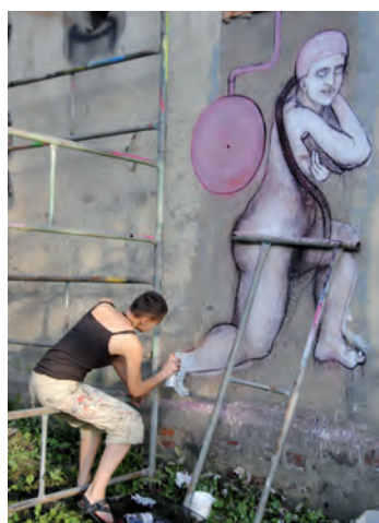
Mural na ścianie Domu Zbornoego malowała Mona Tusz.