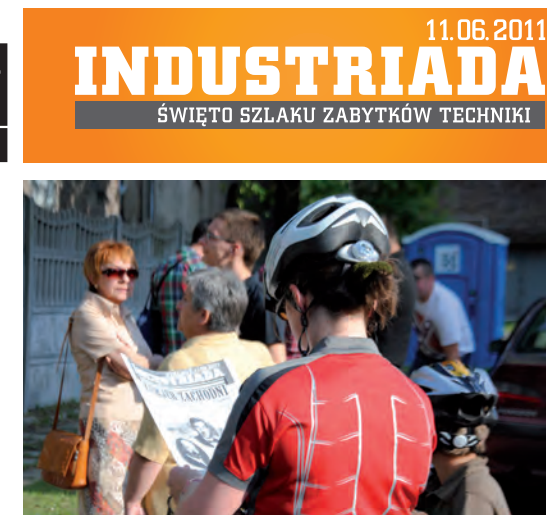
Zainteresowaniem cieszyło się specjalne wydanie „Kuriera Zachodniego” z .. 1939 roku!