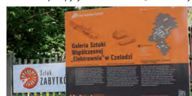
Na wejściu do galerii oraz na ścianie obiektu Urząd Marszałkowski zamontował tablice informacyjne.