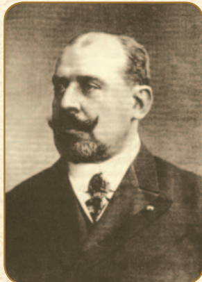
Karol Scheibler II