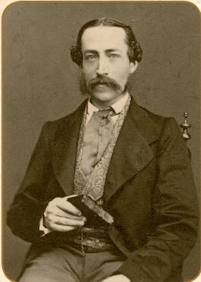
Hugo von Hohenlohe zu Öhringen