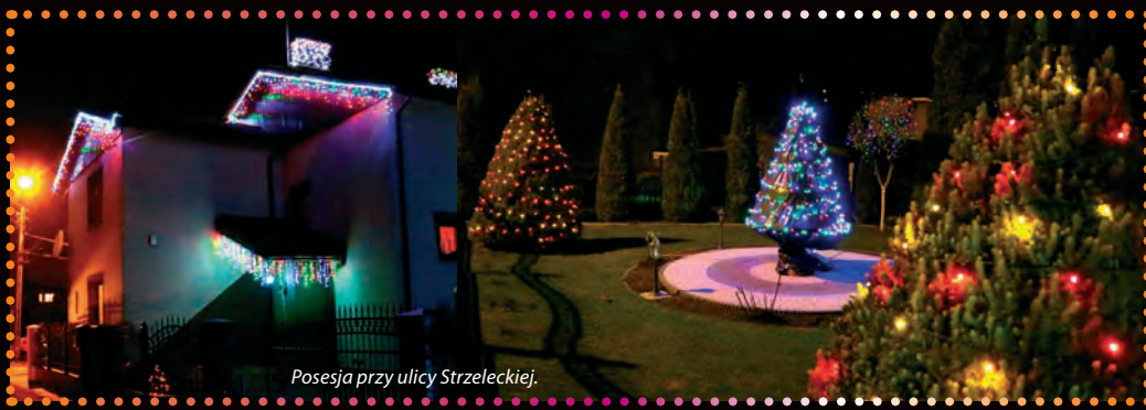
Posesja przy ulicy Strzeleckiej.