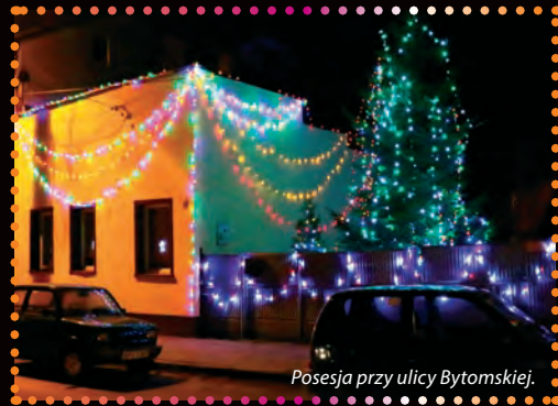
Posesja przy ulicy Bytomskiej.