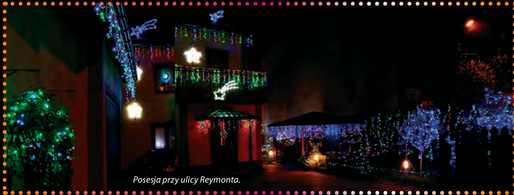
Posesja przy ulicy Reymonta.