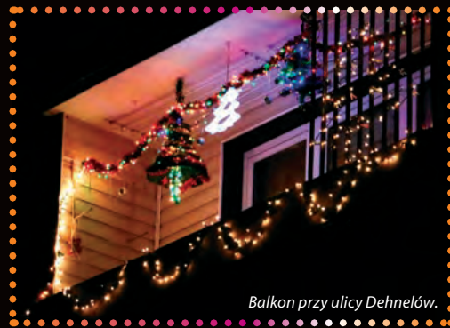
Balkon przy ulicy Dehnelów.

Prezentujemy również inne, bajkowo iluminowane posesje i balkony.