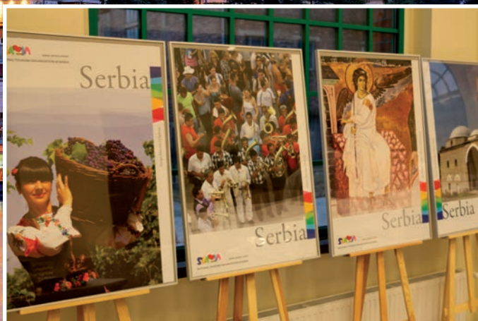
Ekspozycja posterów pokazała urok tego kraju.