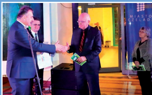
Szczęśliwi laureaci losowania wycieczki do Serbii.