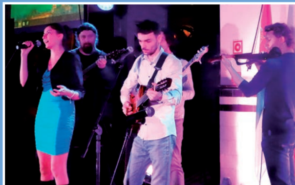
Zespół „Caryna” zachwyił bałkańskimi rytmami.