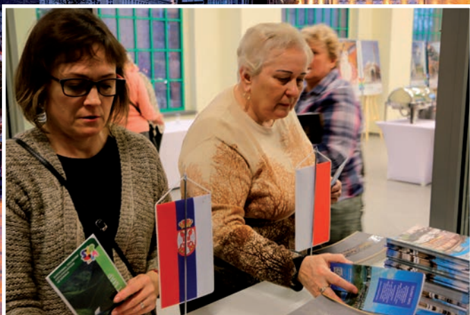
Informatory o Serbii cieszyły się dużym zainteresowaniem.