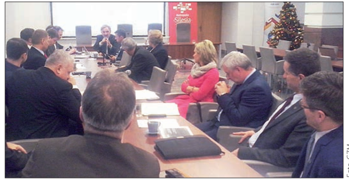
Podczas spotkania w Górnosileskim Związku Metropolitalnym prezydenci i burmistrzowie dyskutowali o przyszłym kształcie metropolii.

28 stycznia 2016 r. radni Rady Miejskiej w Czeladzi jednogłośnie podjęli uchwałę, na mocy której burmistrz miasta został upoważniony do podjęcia wszelkich działań niezbędnych do utworzenia związku metropolitalnego. Wcześniej podobne uchwały podjęły inne miasta Zagłębia: Dąbrowa Górnicza i Sosnowiec, a także wchodzące w skład powiatu będzińskiego Będzin i Wojkowice. Podjęcie przez radę miejską takiej uchwały było formalnością konieczną do kontynuowania działań związanych z wyrażeniem woli przystąpienia przez Czeladź do metropolii.